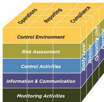
Gambar 3.1. Pengendalian Internal

Kerangka pengendalian internal COSO (2013) menetapkan lima komponen pengendalian internal seperti ditunjukkan pada Gambar 3.1 .